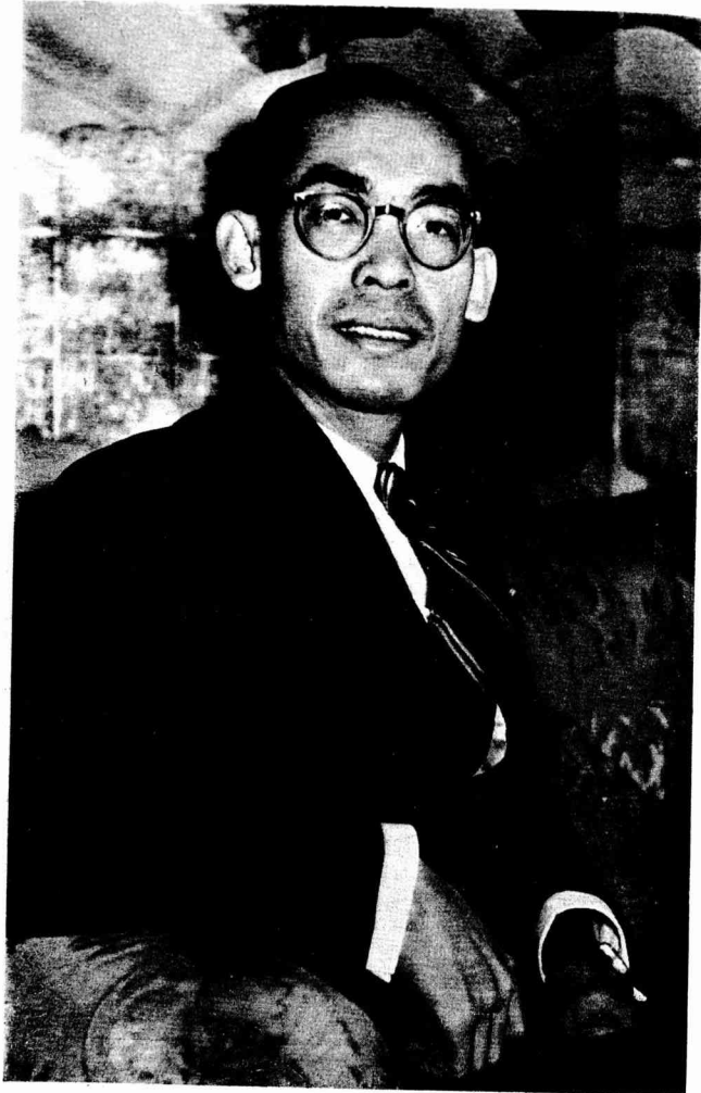
駐日タイ特命全權大使 下閣ムーナヤイヤチ・クレイデ